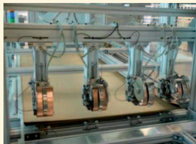
Vorbereiten von Kartonzuschnitten (Überlänge)