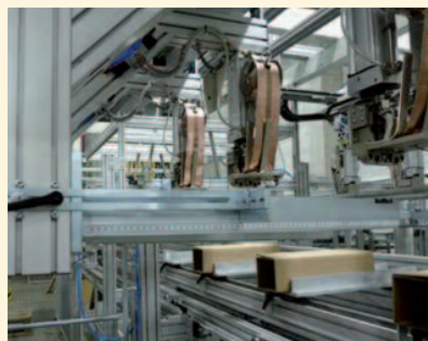
Heften von PAL-Box-Hülsen