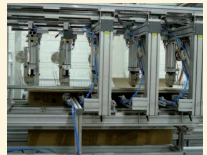
Heftverbindung von Hülsen zu fertiger PAL-Box