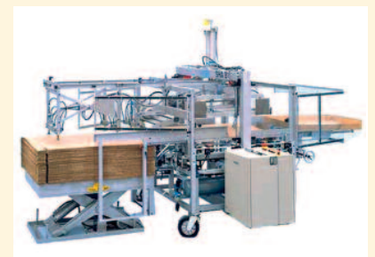
SHA-Heftmaschine: automatische Stülpboden- und Stülpdeckelheftung